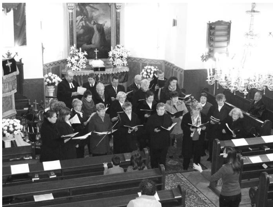
AZ ÉNEKKAR CSISZTU VEZETÉSÉVEL A NOVEMBERI CSALÁDOS ISTENTISZTELETEN SZOLGÁL