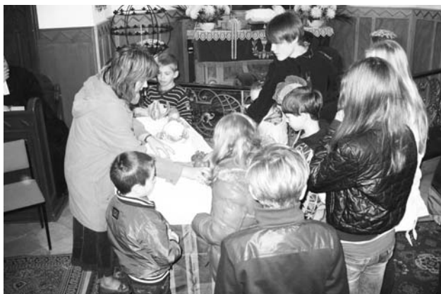
KÉSZÜL A HÁLAADÓ TERMÉNYOLTÁR

Október 11-én többen részt vettünk az országos evangélicizáción a Deák téren.