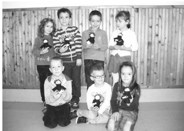
A KISCOPORT TAGJAI A MAGUK KÉSZÍTETTE LUTHER-BÁBUVAL

Az egyházi esztendő utolsó vasárnapján tartottuk a novemberi családi istentiszteletünket. A november