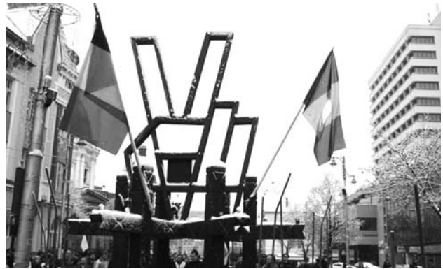
MAROSVÁSÁRHELYI GYŐZELEM EMLÉKMŰ