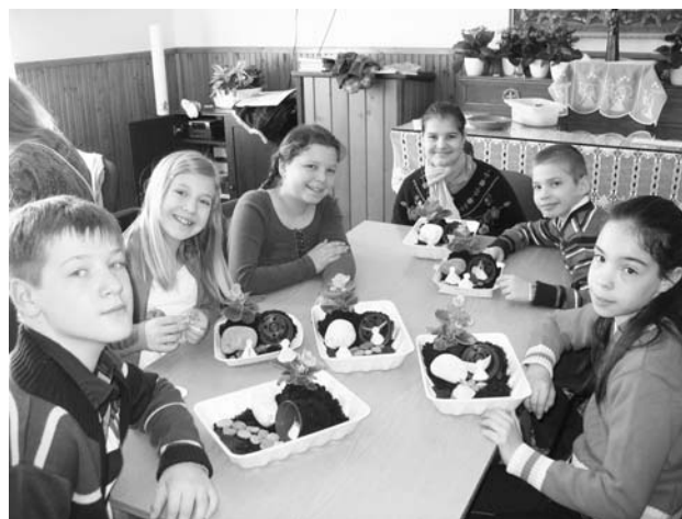
A VASISOK FELTÁMADÁS ÜNNEPÉT JELKÉPEZŐ MAKETTEL

4. és 6. között ismét megszerveztük református testvéreinkkel a szokásos pünkösdi evangélizációs