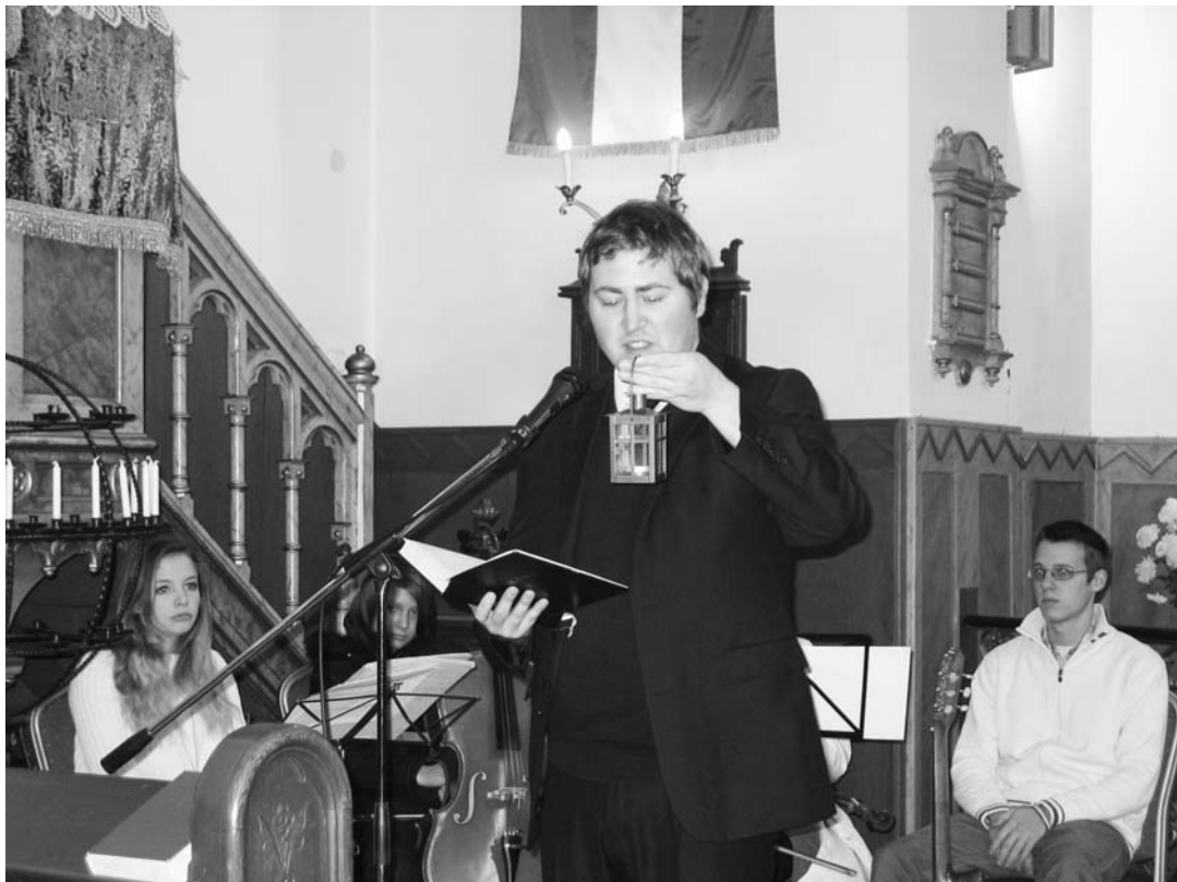
ATTILA A NOVEMBERI CSALÁDOS ISTENTISZTELETEN EGY LÁMPÁSSAL ILLUSZTRÁLTA AZ IGEHIRDETÉSÉT