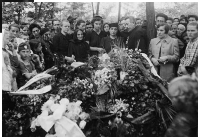
KÉPEK A TEMETÉSŐL