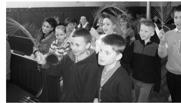
VIRÁGVASÁRNAPI CSALÁDI ISTENTISZTELET