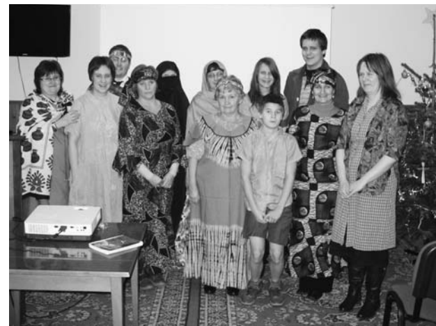
AZ EKME-NAP RUHABEMUTATÓJA