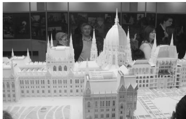
A PARLAMENTBEN A PARLAMENT MAKETTJE MÖGÖTT