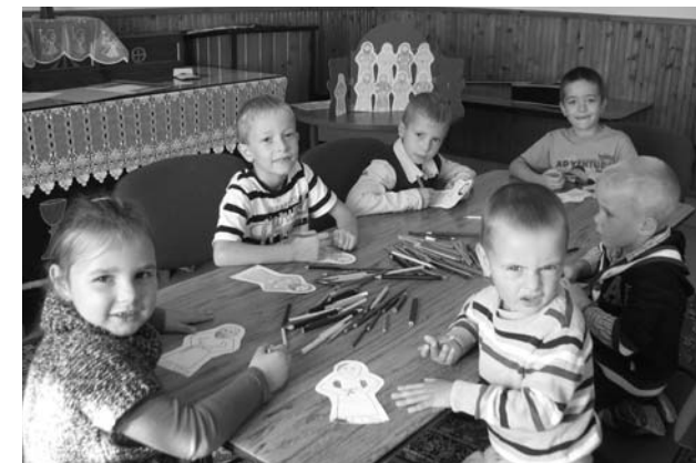
SZEPTEMBERI PILLANATKÉP A VASI KISCOPORTJÁBAN