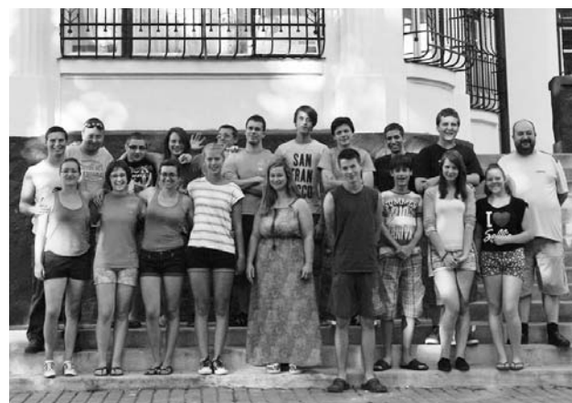
AZ IFIS TÁBOR CSOPORTKÉPE

Július 27. és augusztus 1. között ismét Nagyvelegen tartottuk az ifjúsági táborunkat. Szép, tartalmas, léleképítő és erősítő napokat tölthettünk együtt a fiatalokkal.