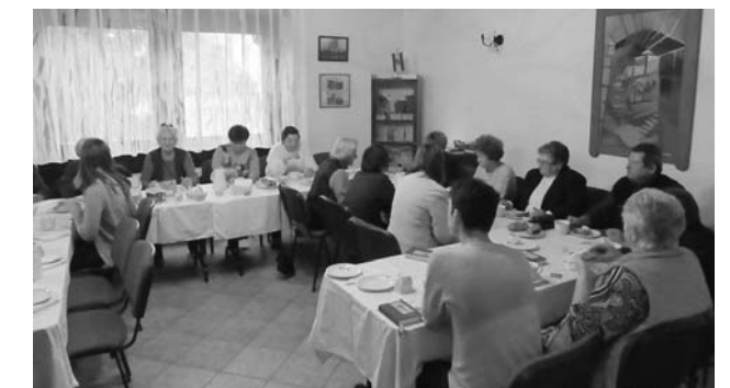
A KÓRUS SZERETETVENDÉGSÉGE

A reformáció napján, 31-én délelőtt „magunkban”, délután református testvéreinkkel együtt ünnepeltük a reformációt.