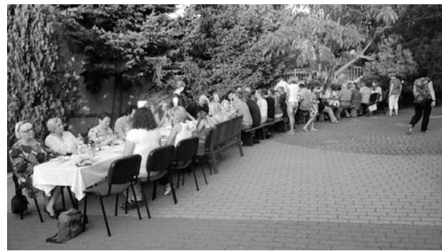
KERTI PARTI A FINNEKEL A GYÜLEKEZETI HÁZ UDVARÁN

A hónapot végigkísérte a sok program mellett az egyre intenzívebb készülődés finn testvéreink foga-