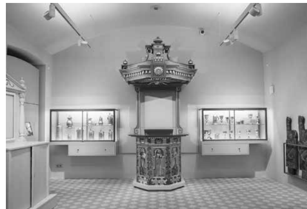
A FELÚJÍTOTT EVANGÉLIKUS ORSZÁGOS MÚZEUM

Egy másik országos közgyűjtemény, a Magyar Nemzeti Levéltár folytatja a forrás-feldolgozásokat, emellett iskolásoknak szóló programokat is szervez ( http://reformacio.mnl.gov.hu/ ).