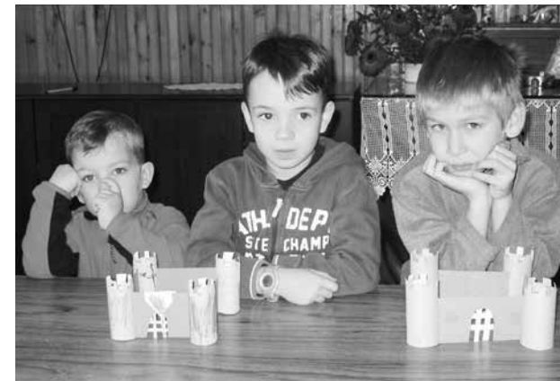
„ERŐS VÁR” A VASI KISCSOPORTJÁBAN